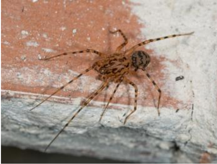
Pla de les Eroles, Castell d'Aro 02.12.23, fotografia de Rosa Matesanz Torrent.