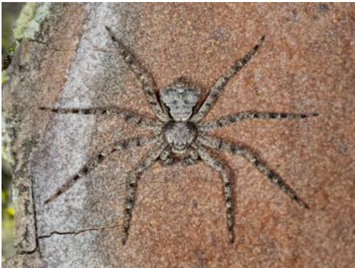
Mas Maiensa, Santa Cristina d'Aro, 27.11.23, fotografia de Rosa Matesanz Torrent.