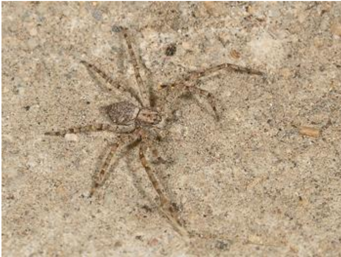
Bassa del Dofí, Castell d'Aro, 15.12.23.