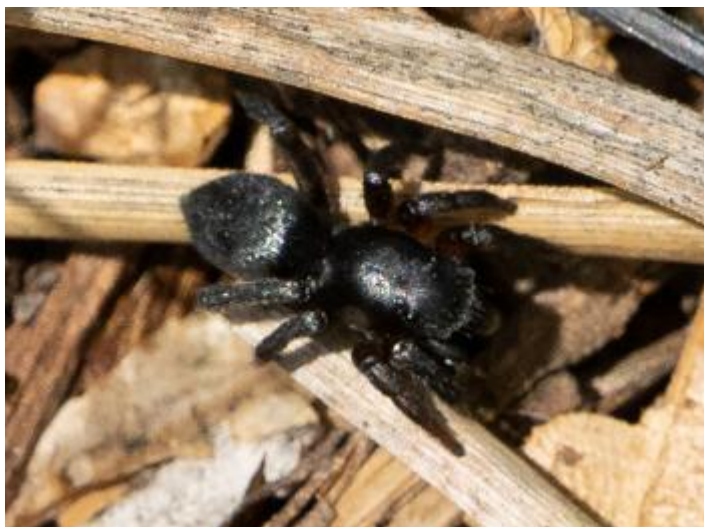
Ruta de les Fonts, Castell d'Aro, 01.05.24.