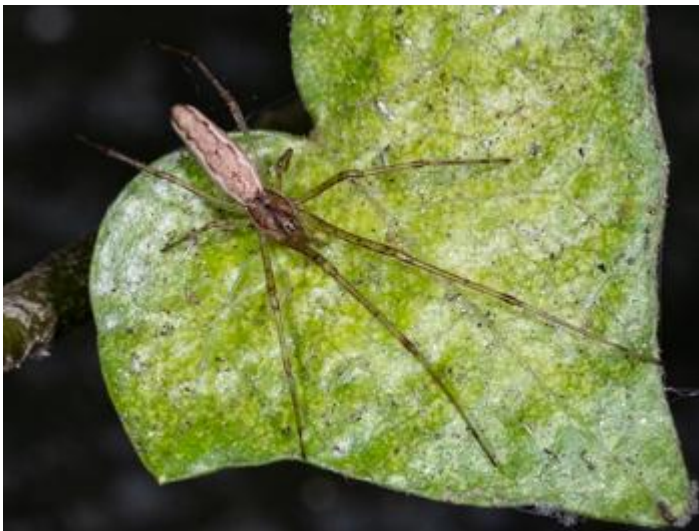
Bassa del Dofí, Castell d'Aro, 11.12.24