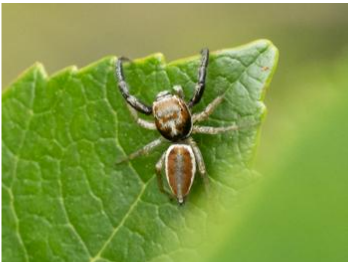
Tram alt del Ridaura, Llagostera, 20.05.24, fotografia de Rosa Matesanz Torrent.