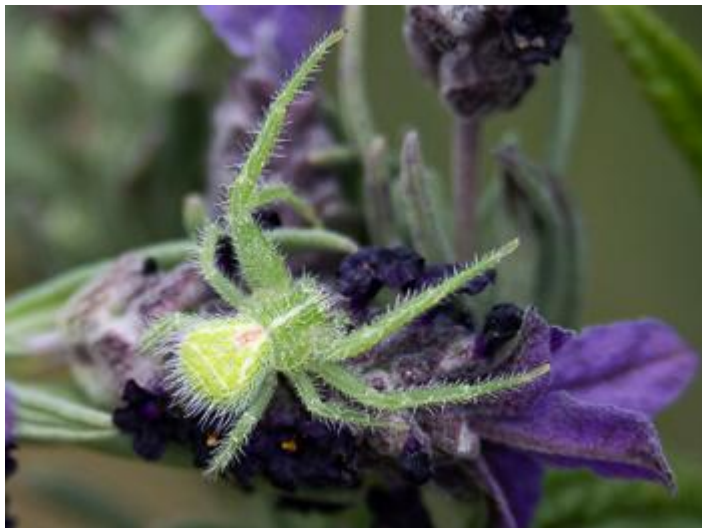
Can Duran del Gatellar, Santa Cristina d'Aro, 10.06.24, fotografia de Rosa Matesanz Torrent.