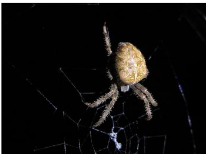
Pla de les Eroles, Castell d'Aro, 18.10.15, fotografia de Rosa Matesanz Torrent.