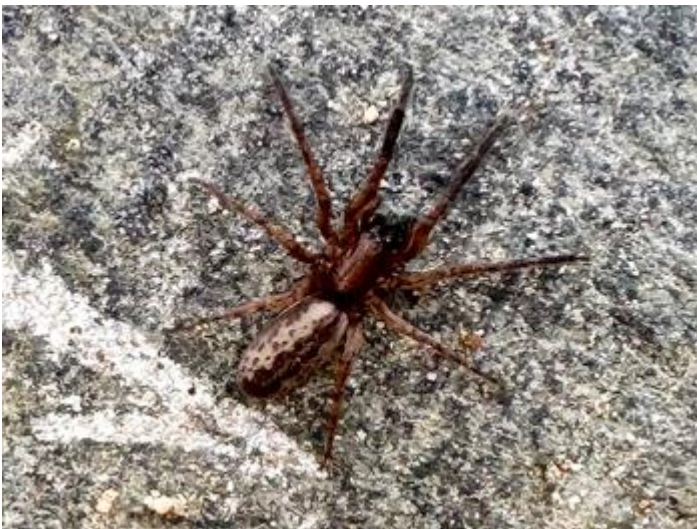
Santa Cristina d'Aro, 20.03.24, fotografia de Rosa Matesanz Torrent.