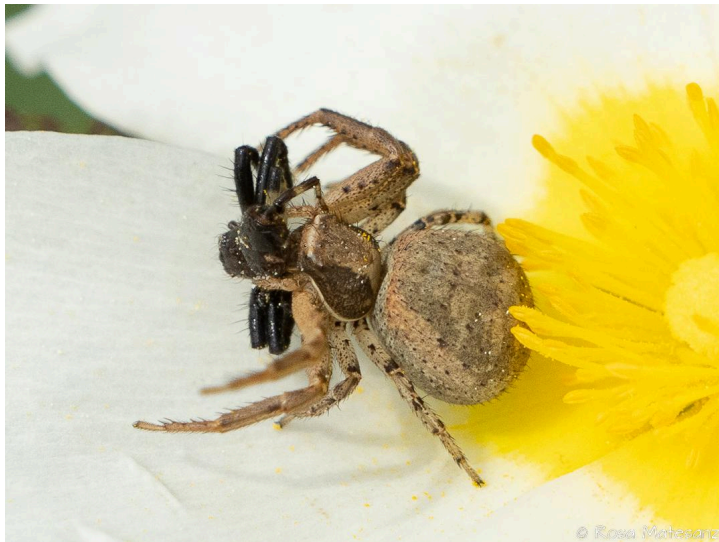
Can Duran del Gatellar, Santa Cristina d'Aro, 15.04.24, fotografia de Rosa Matesanz Torrent.