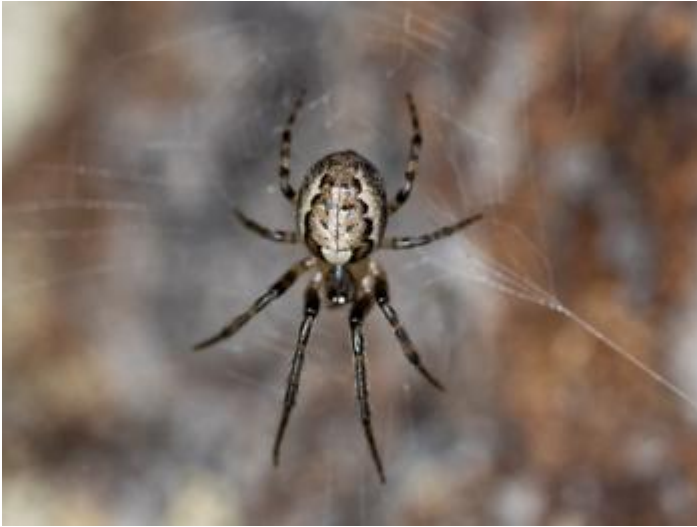
Mas Maiensa, Santa Cristina d'Aro, 27.11.23.