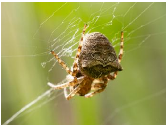
Tram mig del Ridaura, Santa Cristina d'Aro, 08.04.24, fotografia de Rosa Matesanz Torrent.