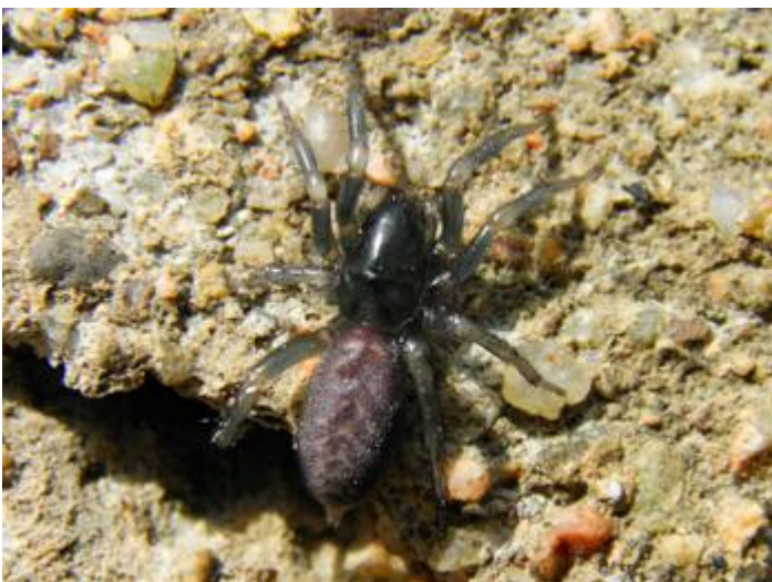
Can Llach, Santa Cristina d'Aro, 22.09.24, fotografia de Carlos Alvarez-Cros.