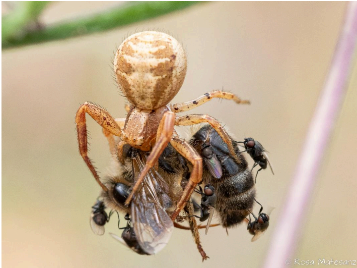
Romanyà de la Selva, 25.06.21, fotografia de Rosa Matesanz Torrent.