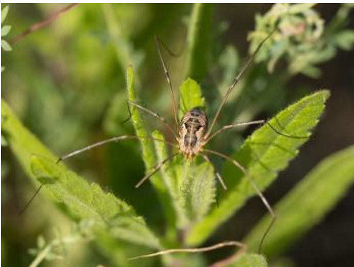
Costa d'Alou, Llagostera, 29.05.23, fotografia de Rosa Matesanz Torrent.