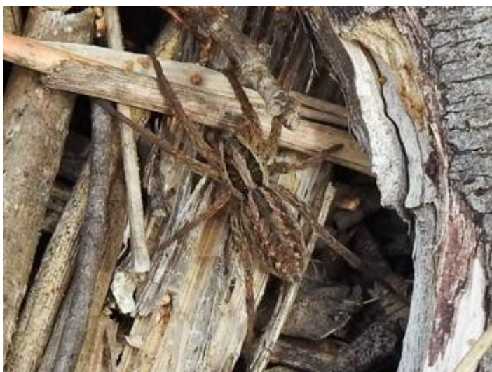
Sant Llorenç, Llagostera, 17.05.24, fotografia de Carlos Alvarez-Cros.