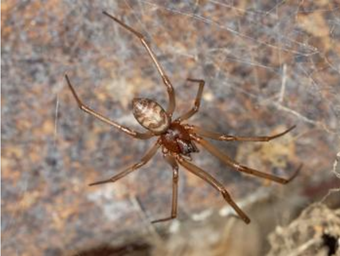
Pla de les Eroles, Castell d'Aro, 05.12.24