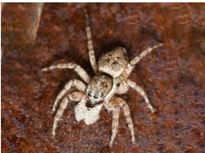
Platja d'Aro, 11.07.23, fotografia de JF Amiot.