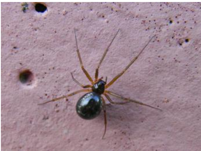
Cal Cuc, Castell d'Aro, 21.11.24, fotografia de Carlos Alvarez-Cros.