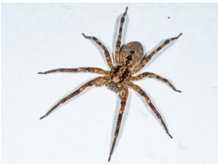
Sant Feliu de Guíxols, 15.12.24, fotografia de Rosa Matesanz Torrent