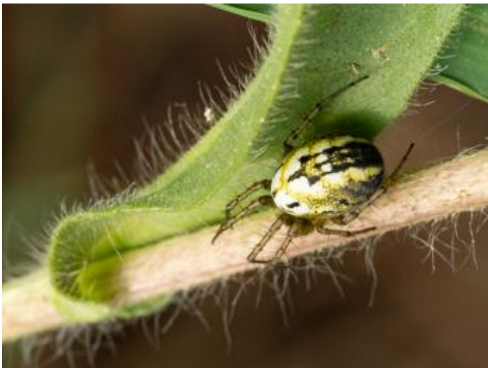
Ruta de les Fonts, Castell d'Aro, 22.05.24.