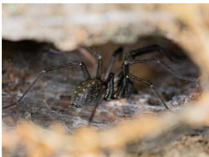
Mas Maiensa, Santa Cristina d'Aro, 27.11.23, fotografia de Rosa Matesanz Torrent.