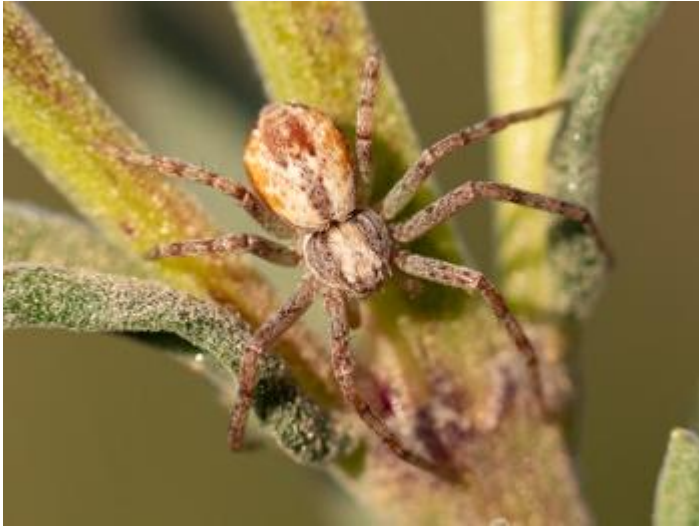
Can Duran del Gatellar, Santa Cristina d'Aro, 29.03.21.