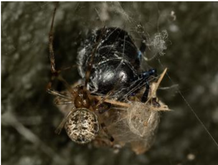
Bassa del Dofí, Castell d'Aro, 26.08.24, fotografia de Rosa Matesanz Torrent.

Pardosa hortensis , Romanyà de la Selva, 1973, Barrientos J.A.