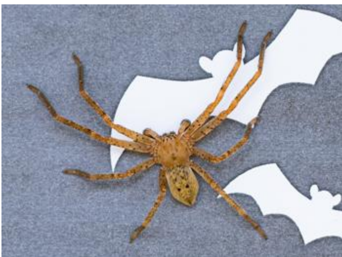
Parc dels Estanys, Platja d'Aro, 27.11.22, fotografia de Rosa Matesanz Torrent.