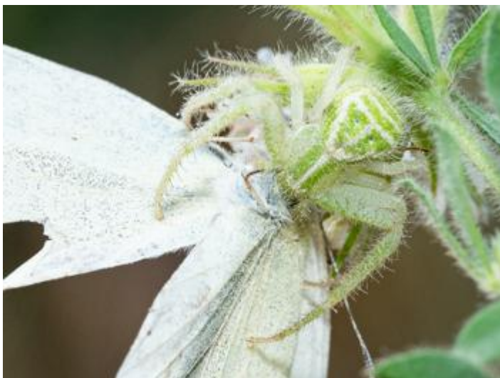
Costa d'Alou, Llagostera, 03.04.23, fotografia de Rosa Matesanz Torrent.