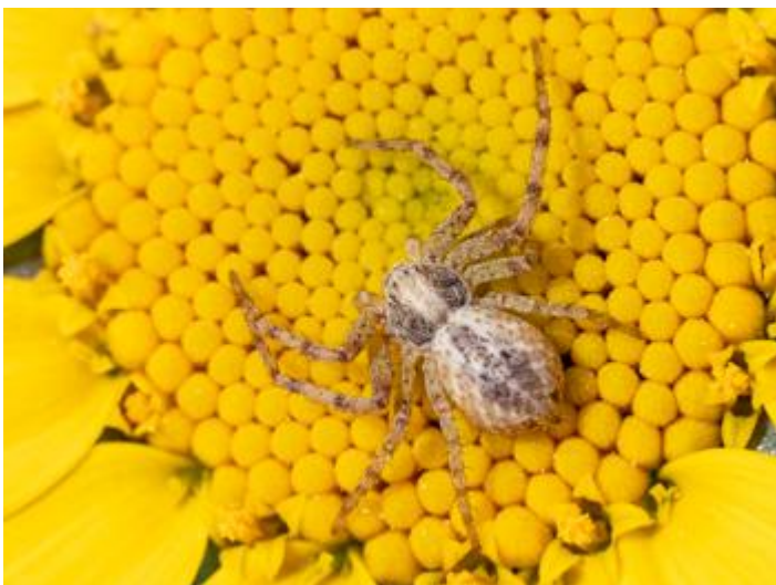
Romanyà de la Selva, 22.05.21, fotografia de Rosa Matesanz Torrent.