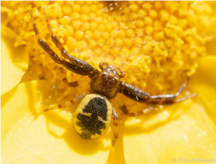
Ruta de les Fonts, Castell d'Aro, 16.04.23, fotografia de Rosa Matesanz Torrent.