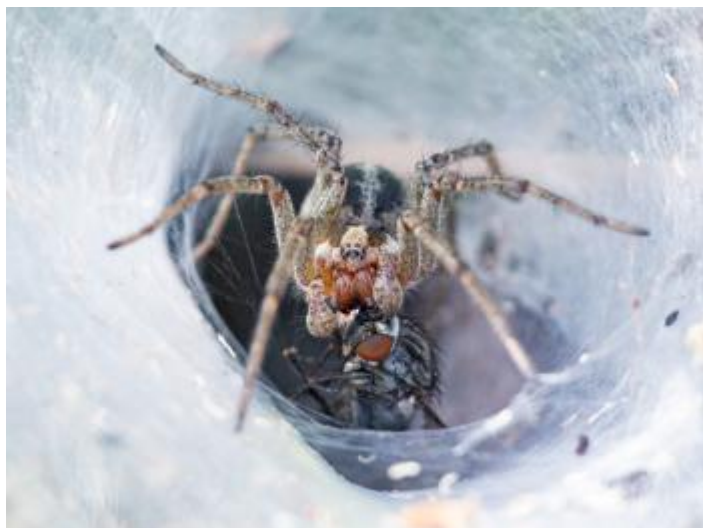
Tram alt del Ridaura, Llagostera, 12.06.14, fotografia de Rosa Matesanz Torrent.