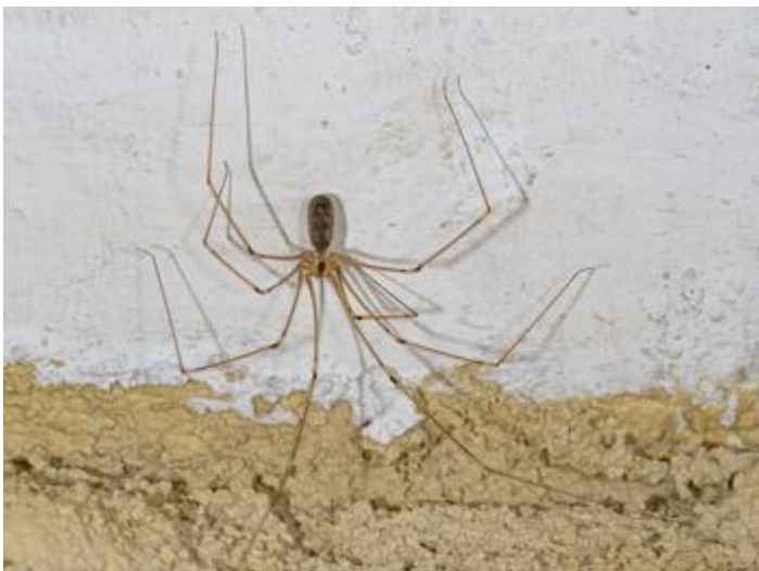
Pla de les Eroles, Castell d'Aro, 27.11.23, fotografia de Rosa Matesanz Torrent. Espècie introduïda.