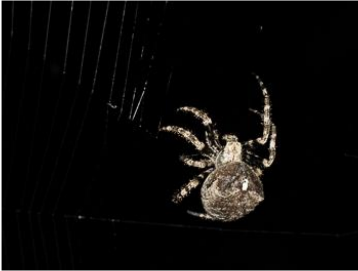
Pla de les Eroles, Castell d'Aro, 27.08.24, fotografia de Rosa Matesanz Torrent.