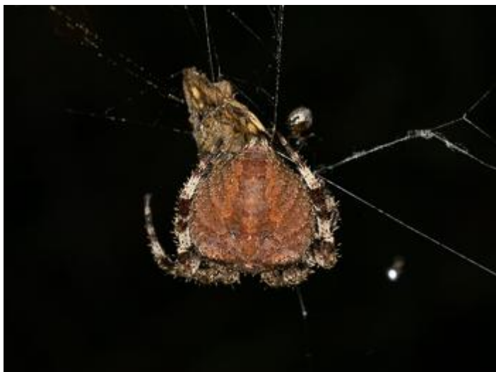
Pla de les Eroles, Castell d'Aro, 01.09.24, fotografia de Rosa Matesanz Torrent.