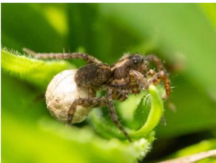
Pla de les Eroles,, Castell d'Aro, 17.03.24, fotografia de Rosa Matesanz Torrent.