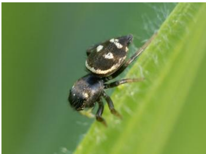
Pla de les Eroles, Castell d'Aro, 17.03.24, fotografia de Rosa Matesanz Torrent.