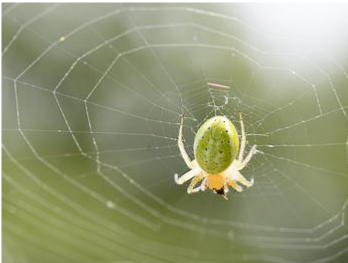
Can Duran del Gatellar, Santa Cristina d'Aro, 20.05.24, fotografia de Rosa Matesanz Torrent.