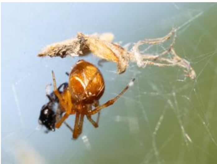
Pla de les Eroles, Castell d'Aro, 04.08.24.