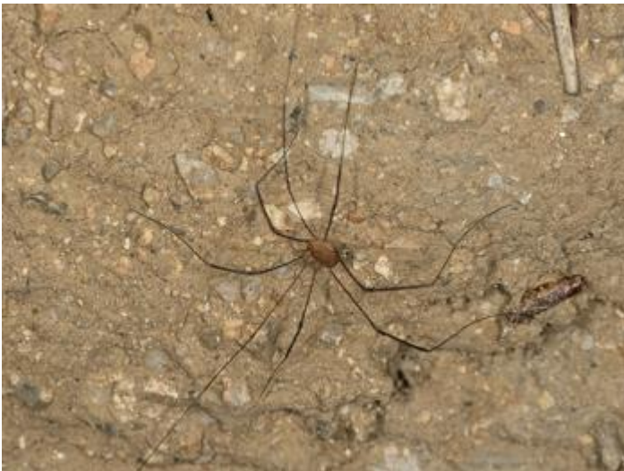
Pla de les Eroles, Castell d'Aro, 02.12.23, fotografia de Rosa Matesanz Torrent.