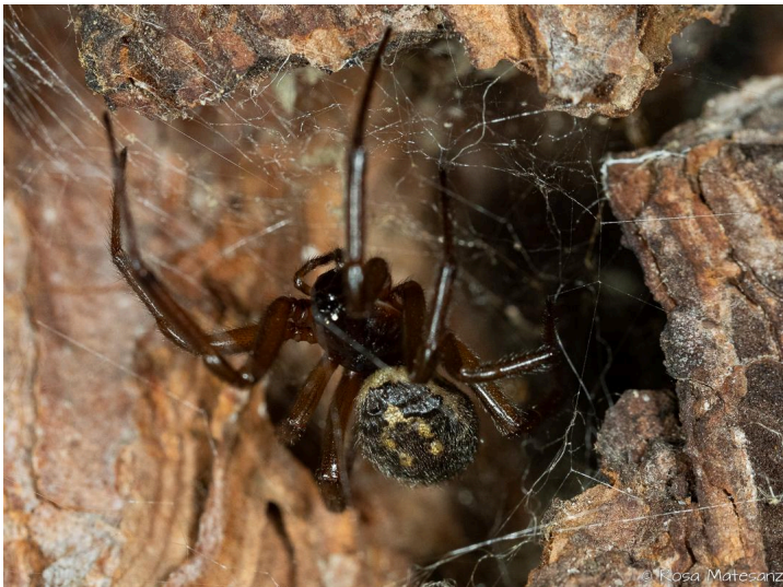
Mas Maiensa, Santa Cristina d'Aro, 27.11.24