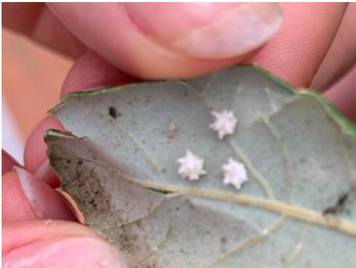
Sant Feliu de Guíxols, 22.09.24, fotografia de Kerbar.