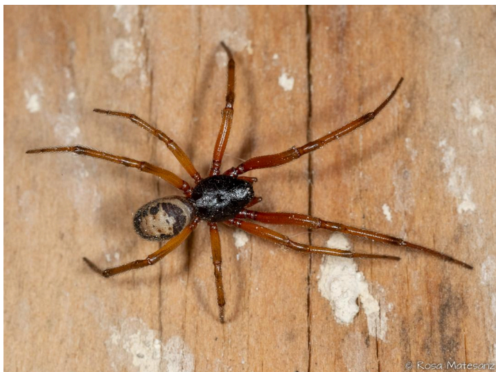
Pla de les Eroles, Castell d'Aro, 05.12.24, fotografia de Rosa Matesanz Torrent.