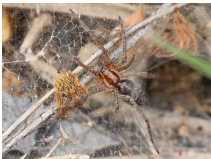
Coll de Solius, Santa Cristina d'Aro, 20.05.24 fotografia de Rosa Matesanz Torrent.