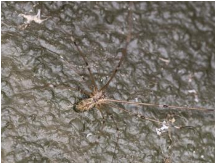
Bassa del Dofí, Castell d'Aro, 15.12.23.