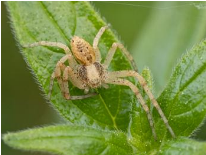
Pla de les Eroles, Castell d'Aro, 05.05.24, fotografia de Rosa Matesanz Torrent.