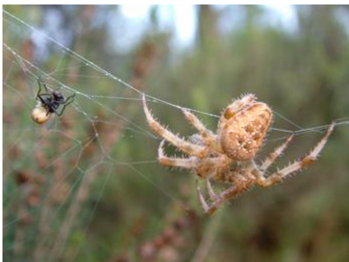
Abocador de Solius, Santa Cristina d'Aro, 28.08.05, fotografia de Carlos Alvarez-Cros.