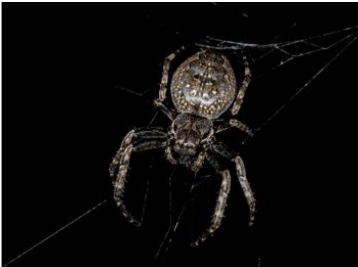
Mas Maiensa, Santa Cristina d'Aro, 27.11.23, fotografia de Rosa Matesanz Torrent.