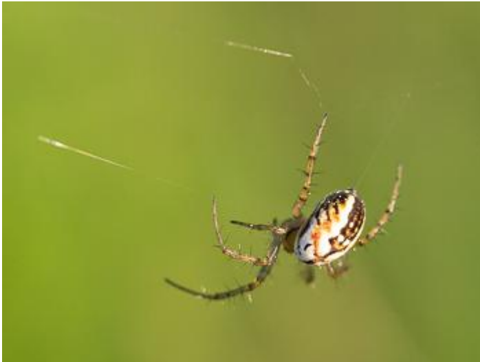
Pla de les Eroles, Castell d'Aro, 24.04.20, fotografia de Rosa Matesanz Torrent.